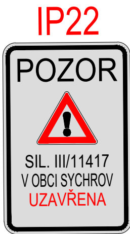
IP 22, upozornění na uzavěru v obci SYCHROV